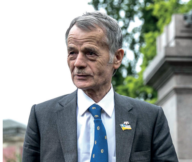
Mustafa Dschmilew, Foto: Ministry of Foreign Affairs of the Republic of Poland/Flickr (CC BY-NC 2.0)