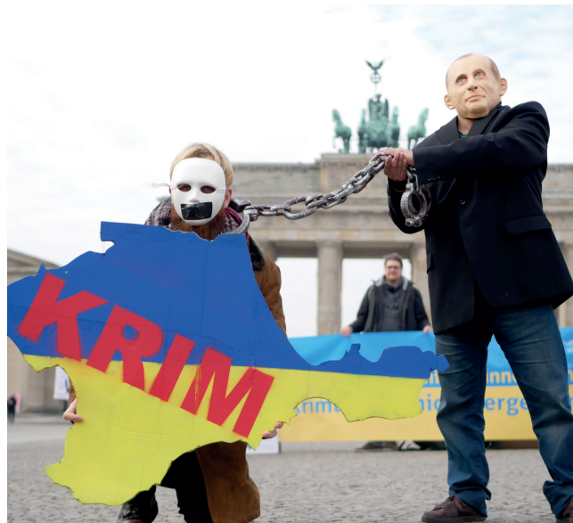
Eine unserer zahlreichen Aktionen für die Krimtatar*innen am 26.02.2019, fünf Jahre der nach russischer Annexion, vor dem Brandenburger Tor in Berlin