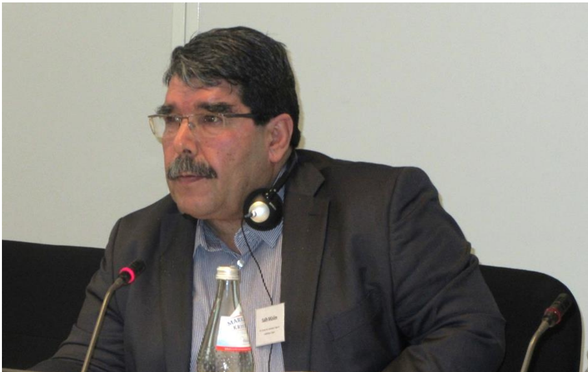
Salih Muslim bei einer Kurdenkonferenz.

Salih Muslim ist syrischer Kurde und ehemaliger Anführer der PYD. Die PYD steht wie die YPG der PKK in einigen Punkten nahe und wird deswegen wie die PKK in der Türkei als terroristisch eingestuft. Durch seine Verbindungen zur PYD wird Salih Muslim in der Türkei als Terrorist gelistet und verdächtigt, bei einem Anschlag in Ankara 2016 mitgewirkt zu haben. Darum erließ die türkische Regierung eine sogenannte „Red Notice“ über INTERPOL gegen Muslim. Im Zuge dessen wurde er in der Nacht vom 24. auf den 25. Februar 2018 in Prag festgenommen,