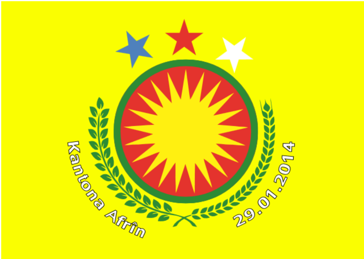
Flagge des Kantons Afrin