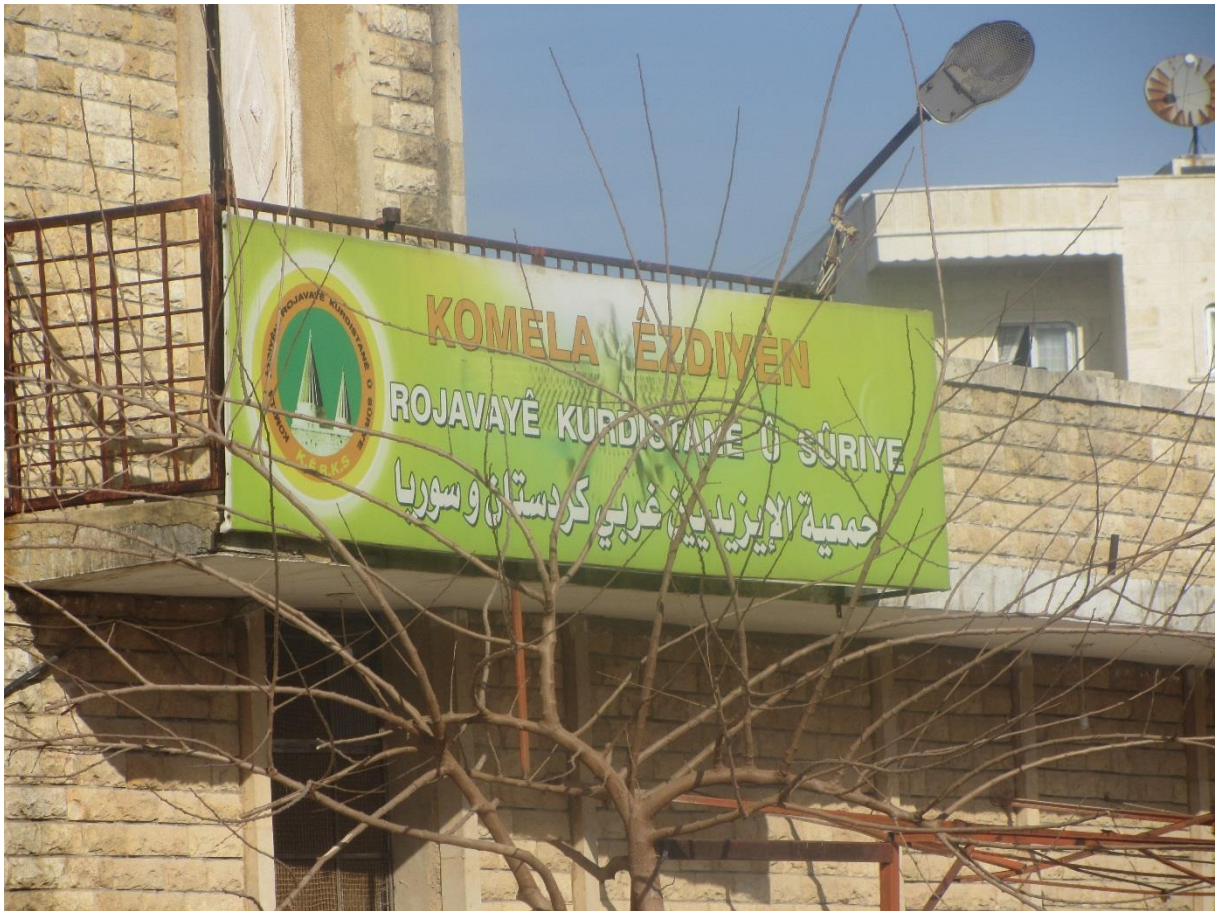
Ein yezidisches Zentrum in Afrin, Februar 2015.

Im Distrikt Mabata in Afrin leben traditionell alawitische Kurden. Wie die Yeziden sind auch sie in tödlicher Gefahr, denn für die Radikalisierungisten gelten die Alawiten als Abtrünnige, die beseitigt werden müssen. Türkische Kampfflugzeuge bombardierten Mabata am 27. Januar 2018 um 04:00 Uhr morgens. Sieben Menschen aus derselben Familie verloren bei dem Bombardement ihr Leben. 28