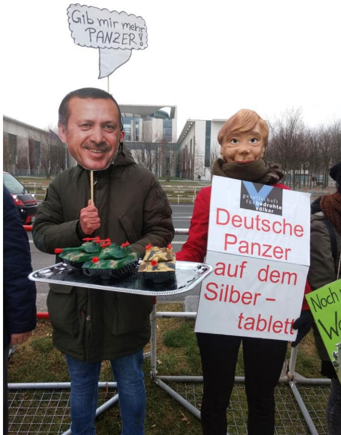
Menschenrechtsaktion der GfbV am 15.02.18 vor dem Bundeskanzleramt in Berlin.

Außenwirtschaftsverordnung (AWV) ermöglicht, laut der „Rüstungskonzerne zwar eine Genehmigung der Bundesregierung brauchen, wenn sie Waffen oder Baupläne für Waffen