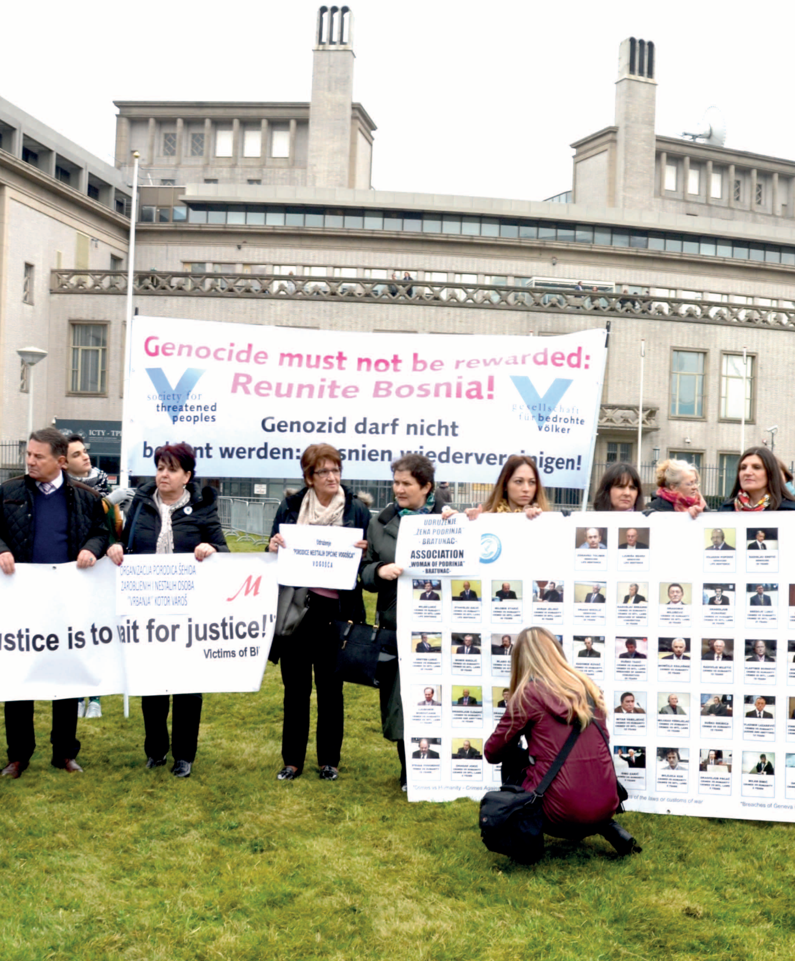
GfbV-Mahnwache mit Angehörigen von Srebrenica-Opfern sowie Exilbosnier*innen vor dem Kriegsverbrechertribunal in Den Haag während der Urteilsverkündung gegen Radovan Karadžić am 24. März 2016