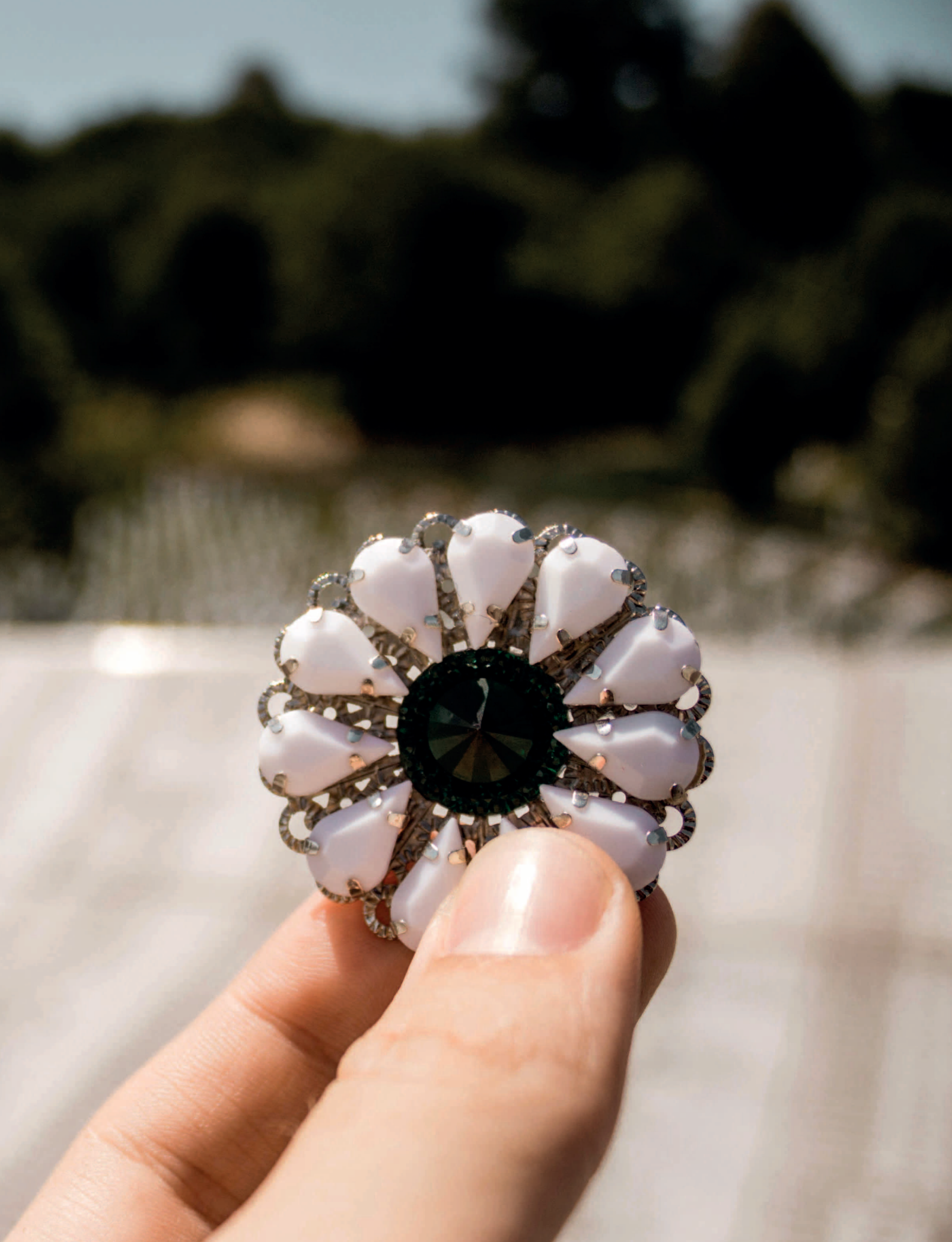
Die „Blume von Srebrenica“