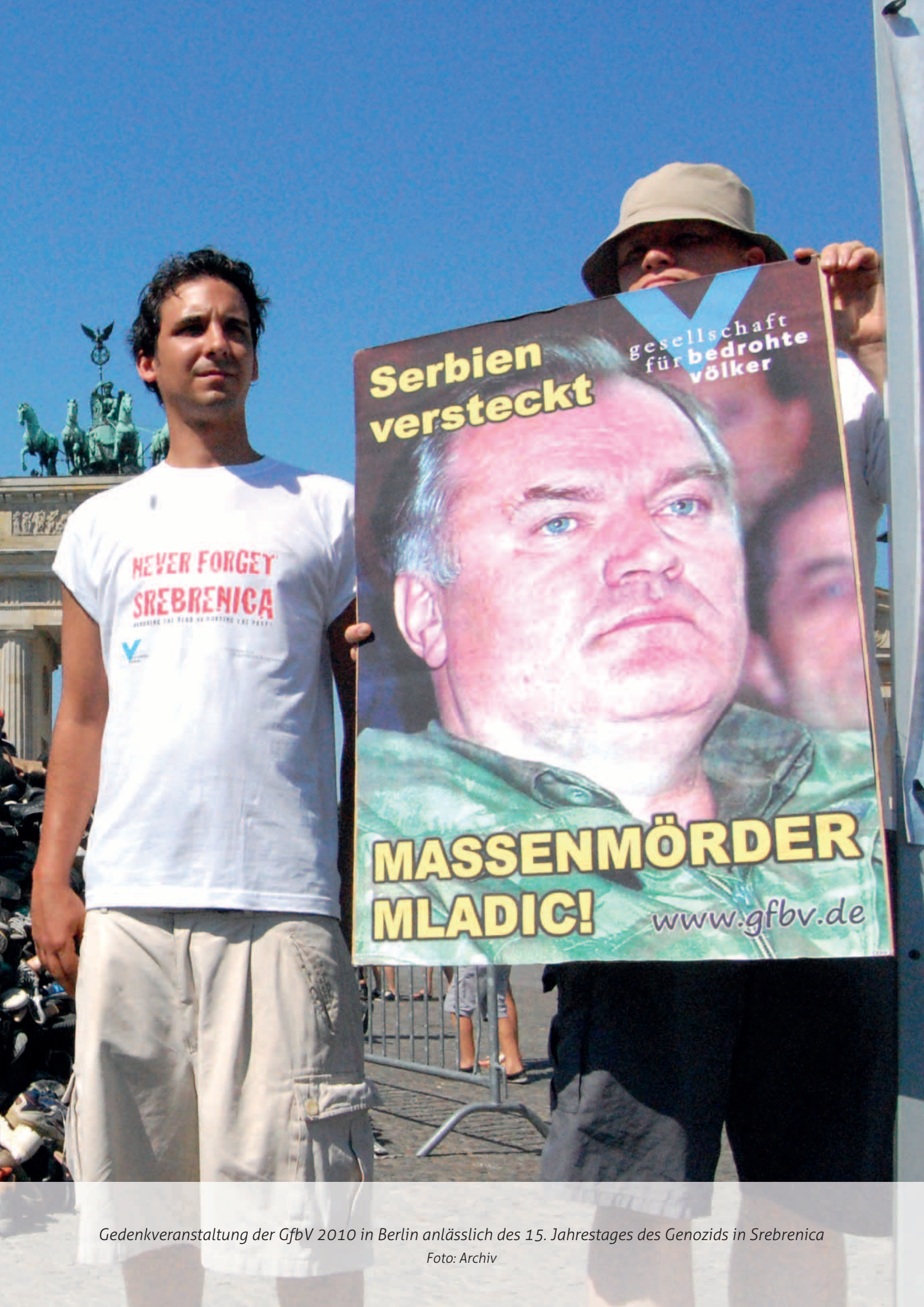
Gedenkveranstaltung der GfbV 2010 in Berlin anlässlich des 15. Jahrestages des Genozids in Srebrenica