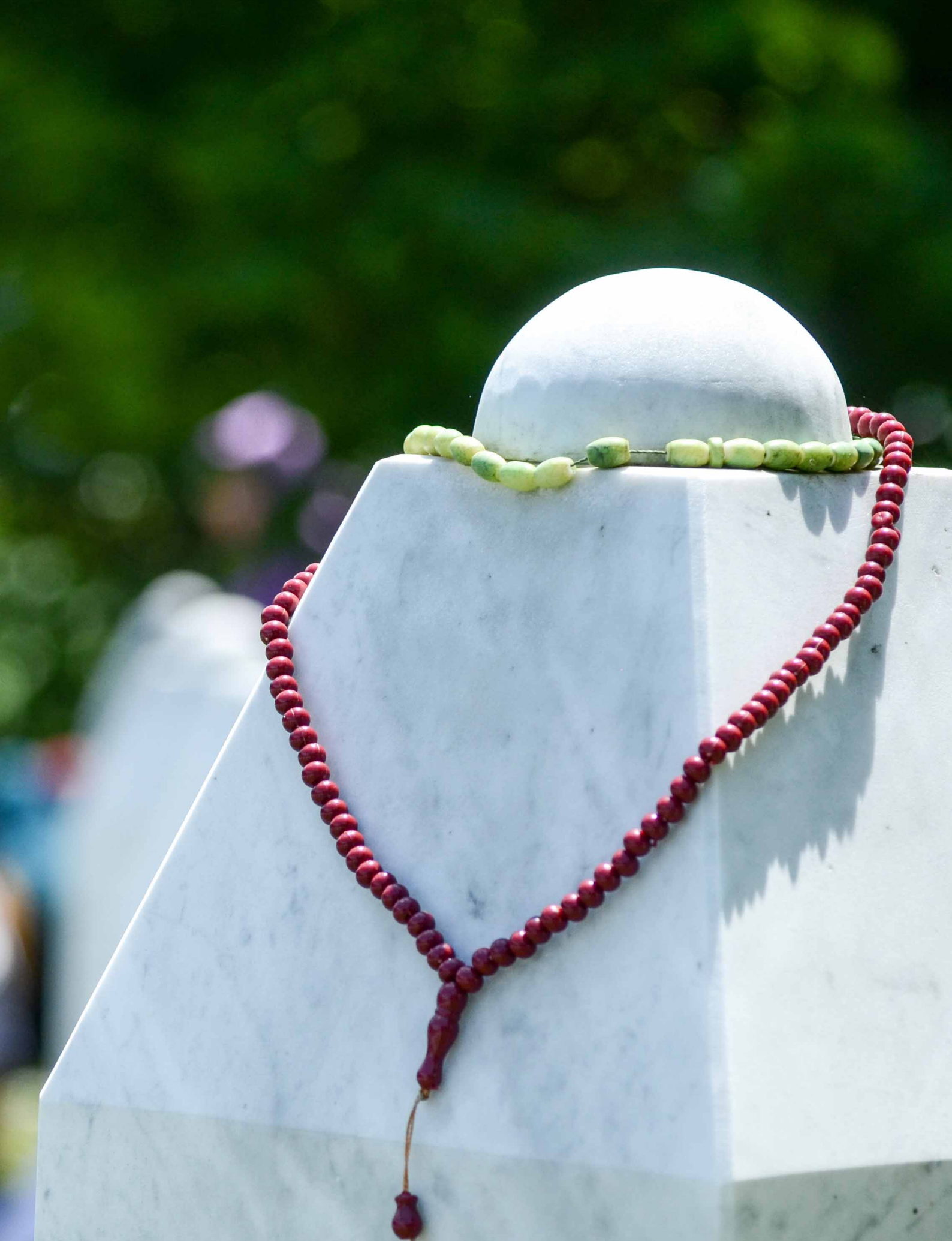
Grabstein auf dem Friedhof der Gedenkstätte Potočari in der Nähe von Srebrenica, Foto: Archiv