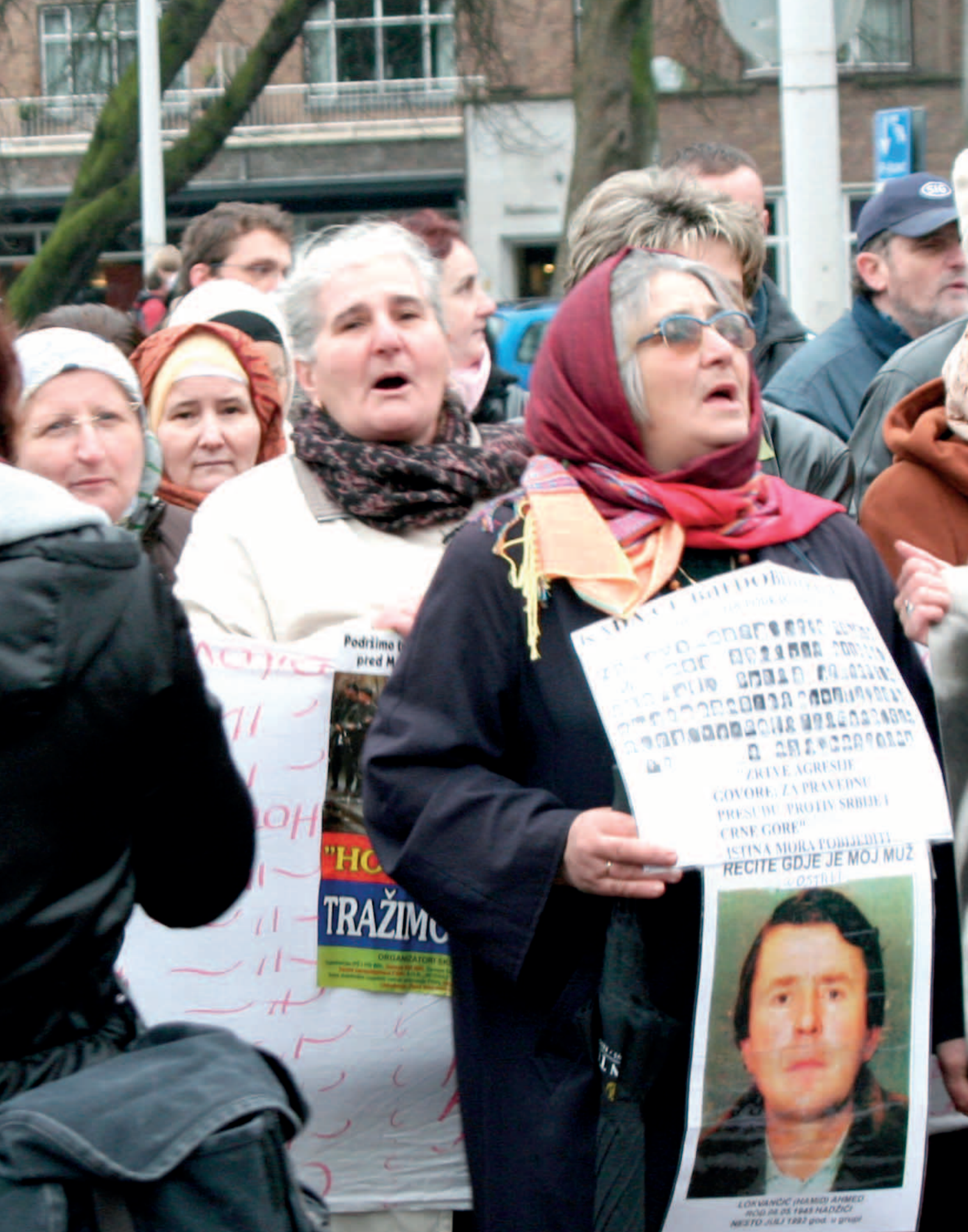
Mahnwache der Frauen von Srebrenica mit der GfbV vor dem Internationalen Gerichtshof in Den Haag 2007