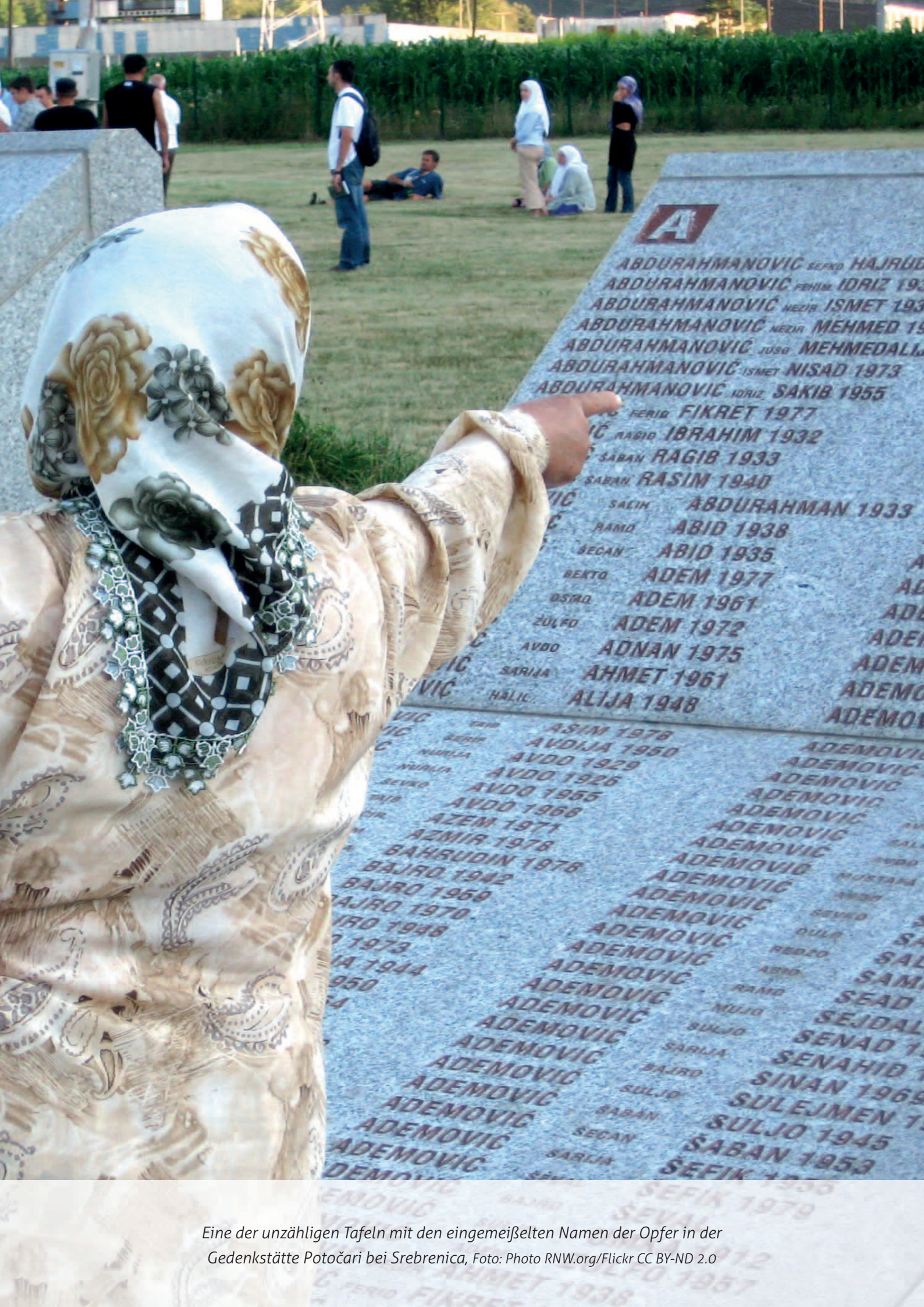
Eine der unzähligen Tafeln mit den eingemeißelten Namen der Opfer in der Gedenkstätte Potočari bei Srebrenica, Foto: Photo RNW.org/Flickr CC BY-ND 2.0