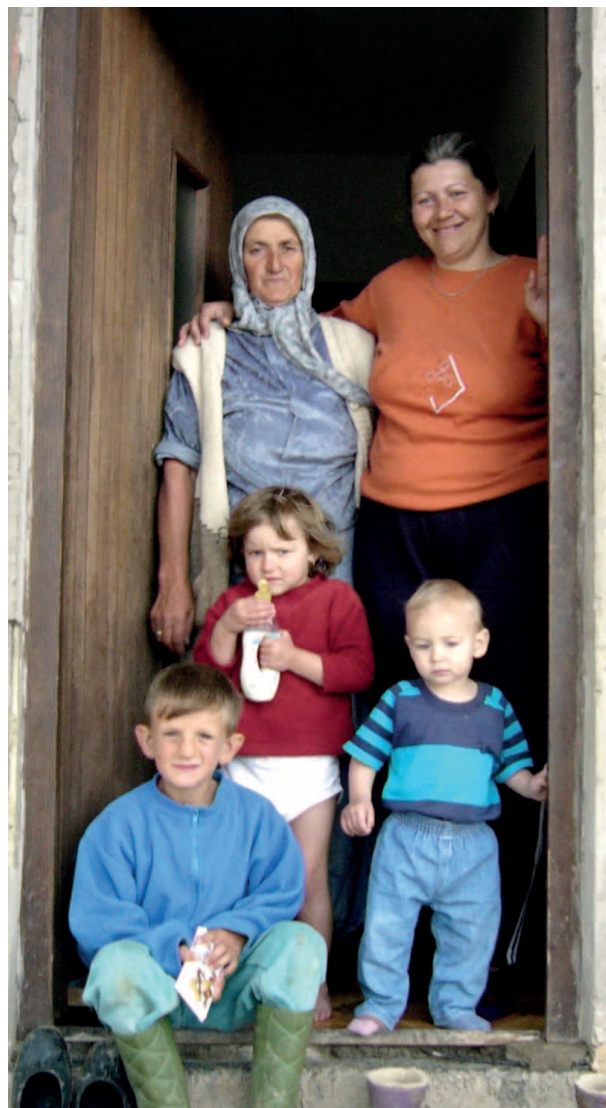
Eine Rückkehrerfamilie aus Srebrenica, der im Rahmen eines GfbV-Hilfsprojekts eine Kuh geschenkt wurde.

ist Direktorin der GfbV-Bosnien und Herzegowina