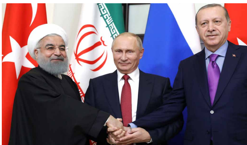
■ Missbrauchen den Islam – auf unterschiedliche Weise – für ihre Zwecke: der ehemalige iranische Präsident Hassan Rohani, der russische Präsident Wladimir Putin und der türkische Präsident Recep Tayyip Erdoğan

Der politische Islam wird von verschiedenen Akteuren, von Muslimen und Nicht-Muslimen, seit Jahren instrumentalisiert, um rein politische, aber auch andere Ziele zu erreichen. Vor mehr als 100 Jahren zum Beispiel,