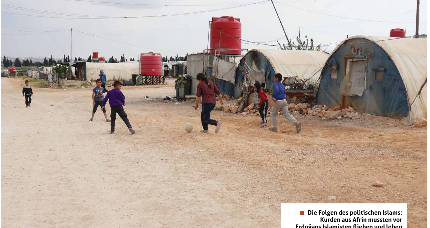
■ Die Folgen des politischen Islams: Kurden aus Afrin mussten vor Erdogans Islamisten fliehen und leben nun in Flüchtlingslagern.

vor und während des Ersten Weltkriegs (1914 bis 1918), projizierten sich schon einmal Machtfantasien kontinentalen Ausmaßes auf das Kalifat und den Heiligen Krieg, wie der Historiker Volker Weiß im Jahr 2014 in der Wochenzeitung DIE ZEIT schrieb. Damals seien es nicht fanatisierte Muslime wie die vom sogenannten „Islamischen Staat“ (IS) gewesen, die sich ein Kalifat erträumten, sondern deutsche Intellektuelle und Politiker. Sie planten, den Islam für ihre Zwecke einzuspannen.