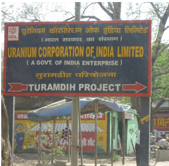
UCIL - Die Firma wird von Ureinwohnern und Umweltschützern heftig kritisiert

Das bedeutendste Uranabbaugebiet Indiens liegt in der Gegend von Jadugoda im indischen Bundesstaat Jharkhand. Dort leben vor allem Angehörige der Adivasi-Völker Ho und Santhal. Im Dorf Dungridih nahe Jadugoda strömten am 24. Dezember 2006 neun Stunden lang tausende Liter radioaktiven Abfalls in einen kleinen Fluss und in die Umgebung der Siedlung. Sie wird überwiegend