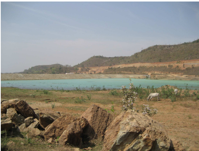
Offene Absatzbecken für radioaktive Abfälle. In der Regenzeit laufen die Becken über und überschwemmen das angrenzende Land mit radioaktivem Schlamm. Eine Gefährdung für die Menschen und Tiere der Region.

Uranerz wird von der UCIL im Gebiet von Jadugoda seit 1967 im Untertagebau gefördert. Gegenwärtig gibt es dort drei Minen, Bhatin, Narwapahar und Jadugoda, welche die in Jadugoda selbst befindliche Uranmühle mit Erz versorgen. Dieses wird dort zu einem feinen Pulver zermahlen, aus dem dann mit Hilfe von Säuren das Uran herausgelöst wird. Das so gewonnene und nach seiner auffälligen Färbung „Yellowcake“ genannte Uranpulver besteht zu 70-80 Prozent aus Uranverbindungen und ist eine wichtige Zwischenstufe bei der Produktion von Kernbrennstoffen.