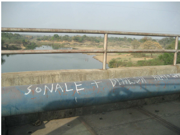
Ungeschützte Rohrleitung mit radioaktiven Abfällen

Es gibt nur wenige Bemühungen, Adivasi in den angrenzenden Dörfern oder die Arbeitskräfte in der Uranmine und -mühle vor der Radioaktivität zu schützen. Nach dem indischen Atomgesetz sind Siedlungen innerhalb eines Radius von 5 km um Atommülldeponien und Absetzbecken nuklearer Abfälle nicht erlaubt. Dessen ungeachtet leben in diesem Bereich 30.000 Menschen. Sieben Dörfer