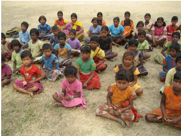
Adivasi-Mädchen beim Schulbesuch in Ranchi

Deutliche Zunahmen gibt es auch bei der Zahl der Fehl- und Totgeburten, bei Impotenz und Kindersterblichkeit sowie bei Blutarmut, Erkrankungen des Nervensystems wie Parkinson und bei Hautkrankheiten wie z.B. Krötenhaut. Beobachtungen von Dorfkrankenschwestern bestätigen übereinstimmend zahlreiche Fehl- und Totgeburten sowie Fälle von Unfruchtbarkeit und Menstruationsproblemen. Eine Delegation der National Commission for Women , die kürzlich eines der betroffenen Dörfer, Telaitannd, besuchte, sah sich diesbezüglich mit einer Flut von Klagen der Dorfbewohnerinnen konfrontiert. Auch in der Tier- und Pflanzenwelt finden sich zunehmend Anzeichen für Strahlenschäden. Kälber werden ohne