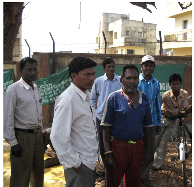
Protestierende Arbeiter vor einer Atomanlage bei Turamdih. Sie leben unmittelbar bei den Urananbauegebieten und Atomwüllddeponien.

Geht es nach dem Willen der Regierung Indiens, dann soll ein neues Gesetz die Haftung von Betreibern atomaren Anlagen drastisch begrenzen. Seit Monaten streiten Indiens Parteien über den Gesetzesentwurf der „Civil Liability of Nuclear Damage Bill“. Das umstrittene Gesetz sieht vor, dass ausländische Lieferanten von kerntechnischen