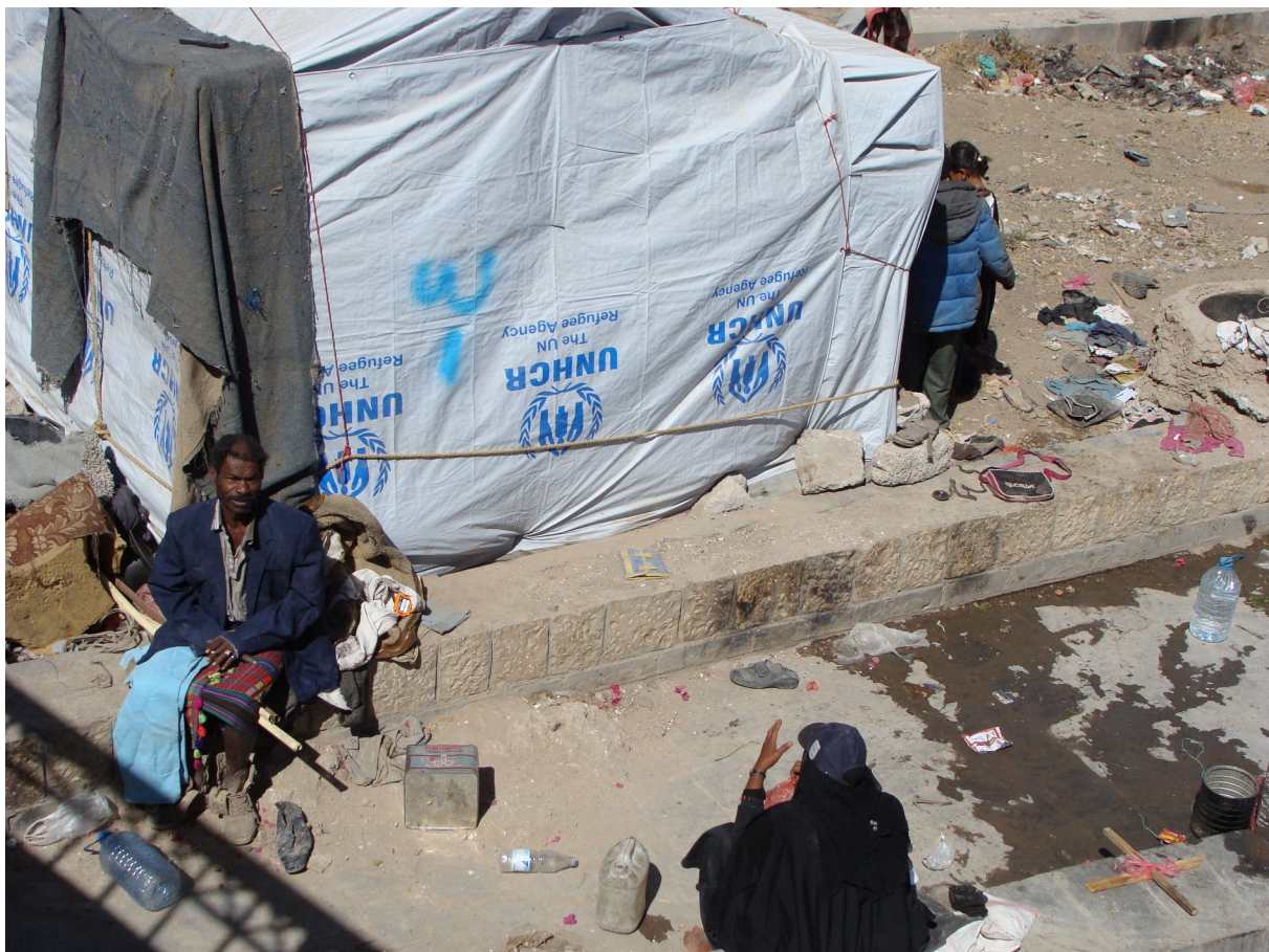
Al-Akhdam am Rande der jemenitischen Hauptstadt Sanaa (Februar 2017).

Widmet die Weltöffentlichkeit dem verheerenden Bürgerkrieg im Jemen schon viel zu wenig Aufmerksamkeit, so nimmt sie erst recht keine Notiz vom Leiden der Minderheiten, die dort leben. Vor allem die Lage der ethno-kulturellen Minderheit der Al-Akhdam, deren Angehörige schon seit Jahrhunderten ausgegrenzt und in allen Lebensbereichen diskriminiert werden, ist prekär. Die meisten von ihnen leben in einfachen Hütten oder armseligen Unterkünften. Und nun müssen sie wegen der andauernden Luftschläge der „Saudischen Militärkoalition“ und der kriegerischen Auseinandersetzungen ihre Hütten immer wieder verlassen, um anderswo ihre Zelte aufzuschlagen.