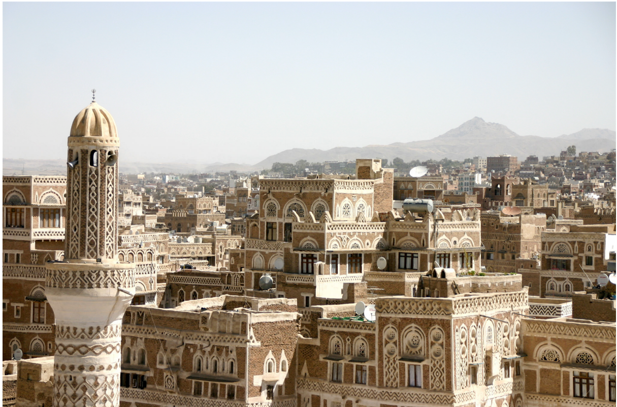
Blick über die Hauptstadt Sanaa.

Auch wenn die aus dem Nordjemen stammenden Huthi in früheren Jahren gegen die Regierung unter der Führung von Salih gekämpft hatten, waren sie nun bereit, mit dem ebenfalls zu den schiitischen Zaiditen gehörenden Salih zu kooperieren. Auch der Ex-Präsident, den die sunnitisch-saudische Dynastie in früheren Jahren unterstützt hatte, war bereit, gegen den neuen Feind Saudi-Arabien zu kämpfen. Salih ging nun eine taktische Allianz mit den Huthi gegen Saudi-Arabien ein. Aufgrund dieser Kooperation und mit Hilfe der Unterstützung der Salih loyalen Armeeeinheiten gelang es den Huthi nach und nach, weitere Gebiete des Landes einschließlich der südjemenitischen Metropole Aden zu besetzen.