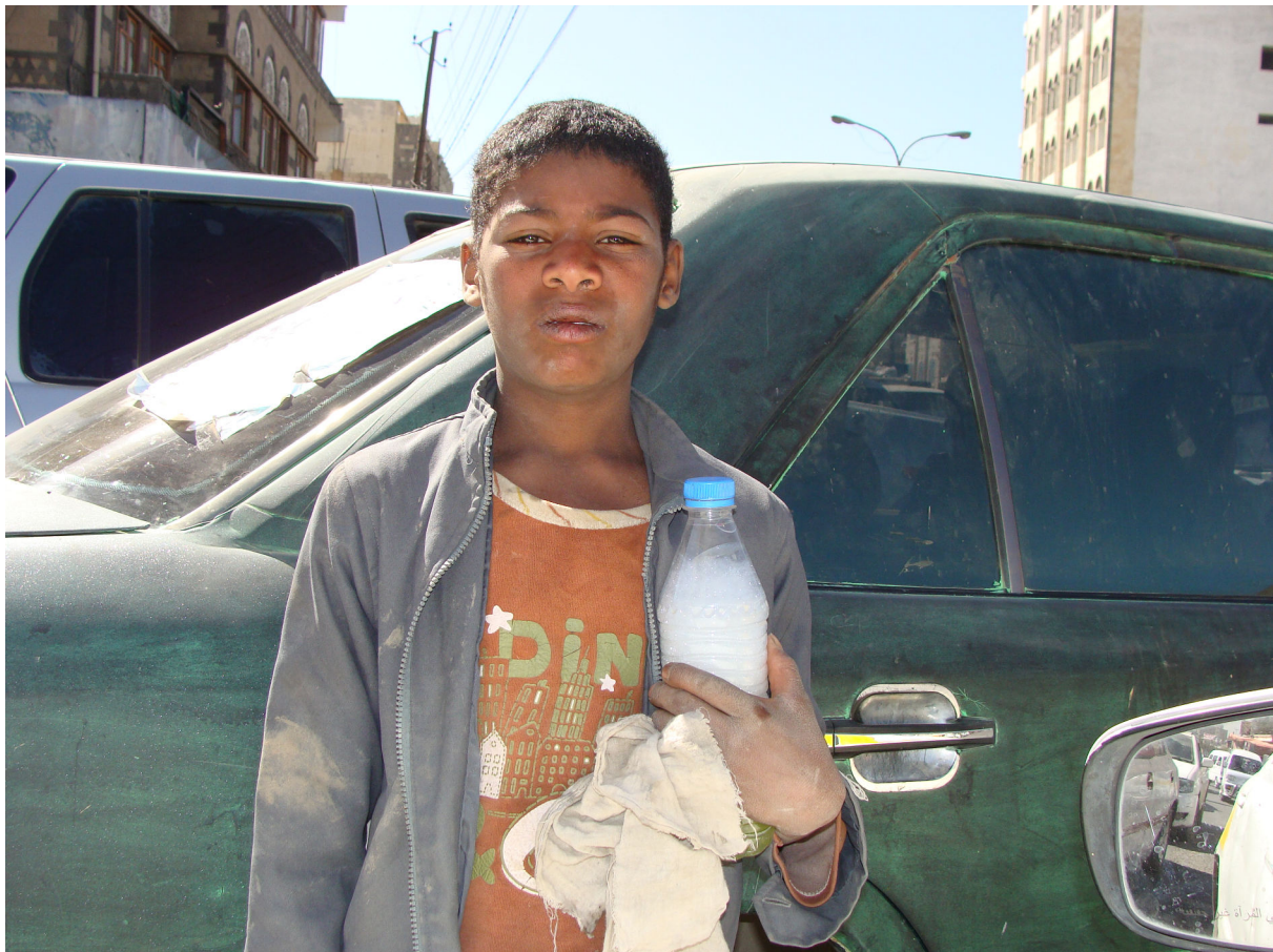
Hunderttausenden Kindern im Jemen droht der Hungertod.

Dem Jemen droht aus Sicht des UN-Nothilfekoordinators Stephen O'Brien der Kollaps, „falls die Konfliktparteien nicht bald ein Friedensabkommen schließen“. 1 Dort herrscht seit Jahren Bürgerkrieg, der dramatisch eskalierte, seit im März 2015 Saudi-Arabien auf Seiten der gewählten international anerkannten Regierung intervenierte. Die saudische Luftwaffe bombardiert schiitische Huthi-Rebellen und trifft auch zivile Ziele wie Krankenhäuser, Marktplätze oder Wohnviertel. Die Lage der Zivilbevölkerung ist katastrophal: Ende 2016 waren etwa 21,2 Millionen Menschen, also fast 85 Prozent der Bevölkerung, auf humanitäre Hilfe angewiesen. Etwa 7,6 Millionen, darunter drei Millionen Kinder und Frauen, leiden an Unterernährung. Auch Epidemien wie Cholera sind bereits ausgebrochen. Zudem wurden seit Beginn der saudischen Intervention im März 2015 zwischen 4.000 und 10.000 Zivilisten getötet, mindestens 10.000 verletzt und mindestens drei Millionen Jemeniten sind mittlerweile auf der Flucht.