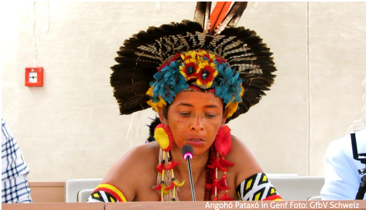
Angohó Pataxó in Genf

Während die Aufarbeitung der Unternehmensverantwortung von Nicht-regierungsorganisationen bearbeitet wird und die Schadensersatzklagen an den Gerichten verhandelt werden, kämpfen die Pataxó parallel für die Rechte ihrer Umwelt. Denn Schadensersatz, so wichtig er auch für die Indigenen ist, wäre nur dann eine Lösung, wenn er auch das Land retten kann. Bleibt das Land langfristig unbewohnbar, die Böden verseucht und das Trinkwasser kontaminiert, ist auch ihre Existenz als Indigene zerstört. Es bleibt abzuwarten, ob es Behörden und staatlichen Institutionen gelingt, gemeinsam mit den Pataxó eine Lösung zu finden. Eine, die zeigt, dass in Brasilien indigenes Leben rechtlich garantiert ist – so wie in der Verfassung verankert.