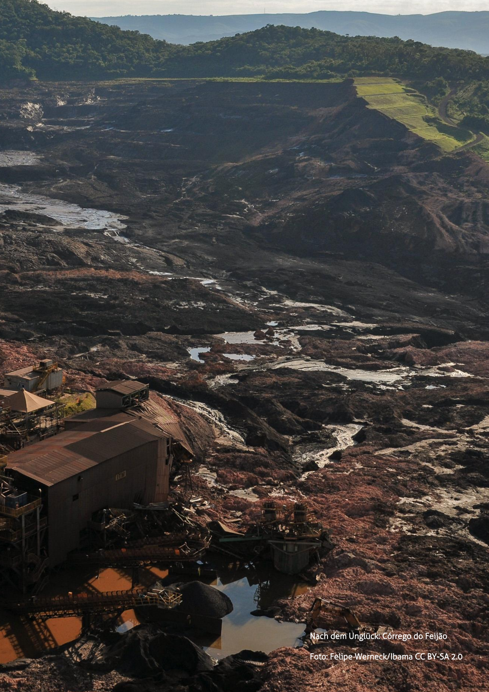
Nach dem Unglück: Córrego do Feijão