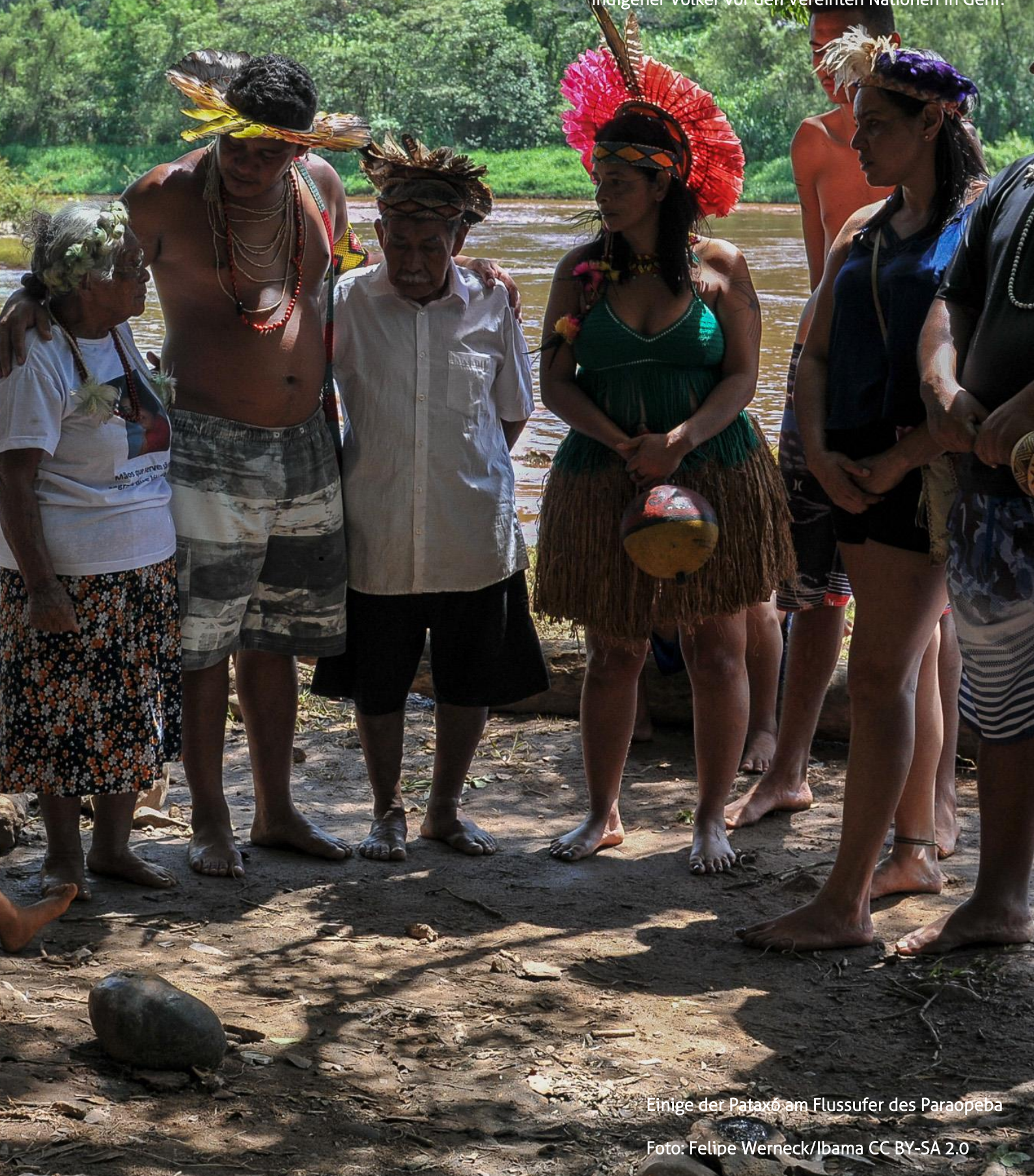
Einige der Pataxó am Flussufer des Paraopeba

sagte sie beim Expertenmechanismus für die Rechte indigener Völker vor den Vereinten Nationen in Genf.