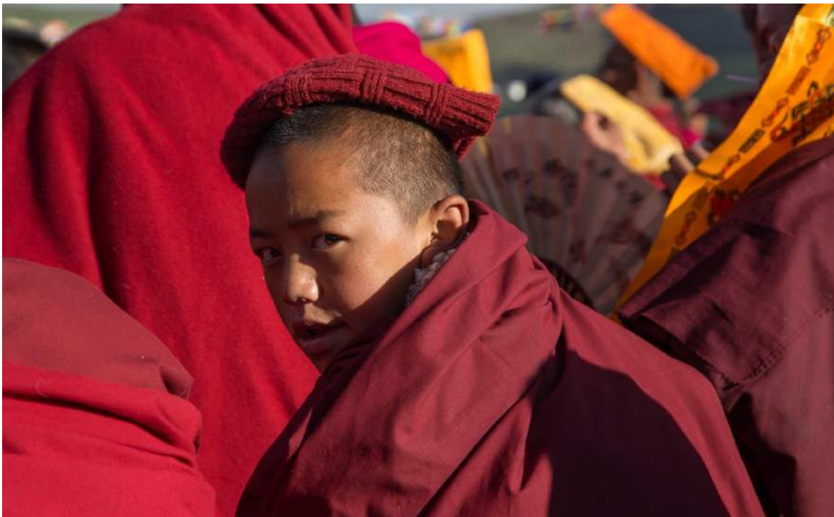
Junger Mönch in Larung Gar.

Die Politik Chinas zielt darauf ab, Klöster zu kontrollieren und die Zahl der Nonnen und Mönche zu reduzieren. Deshalb haben die chinesischen Behörden die Verwaltung einiger Klöster und Tempel übernommen. Zudem überwachen sie religiöse Zusammenkünfte und wirtschaftliche Aktivitäten der religiösen Institute. Sie beanspruchen das Recht für sich, Reinkarnationen zu bestimmen und diese als prominente religiöse Persönlichkeiten einzusetzen. Diese wiederum werden dazu gezwungen, sich für die Regierung auszusprechen und an politischen Erziehungskampagnen teilzunehmen.