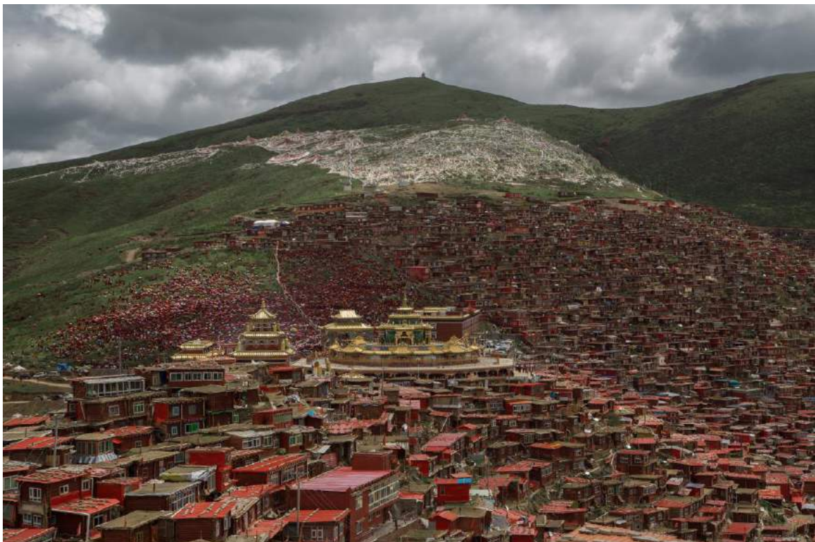
Larung Gar.

Zuerst mussten fast alle Einwohner, die aus Lhasa stammen, das Institut verlassen, nur rund 100 Mönche mit einer offiziellen Genehmigung zum Studieren durften bleiben. Auch Nonnen und Mönche aus dem Bezirk Driru (Biru), Nagchu waren unter den ersten, die vertrieben wurden. Denjenigen, die sich weigern zu gehen, werden „Konsequenzen“ für ihre Familien angedroht. Driru wird von den chinesischen Behörden als ein politisch instabiler Bezirk angesehen, da die dort lebenden Tibeter und Tibeterrinnen sich lange geweigert haben, sich gegenüber der Regierung in Peking als loyal zu erklären. Aus diesem Grund gab es in den vergangenen Jahren viele Restriktionen in dieser Gegend.