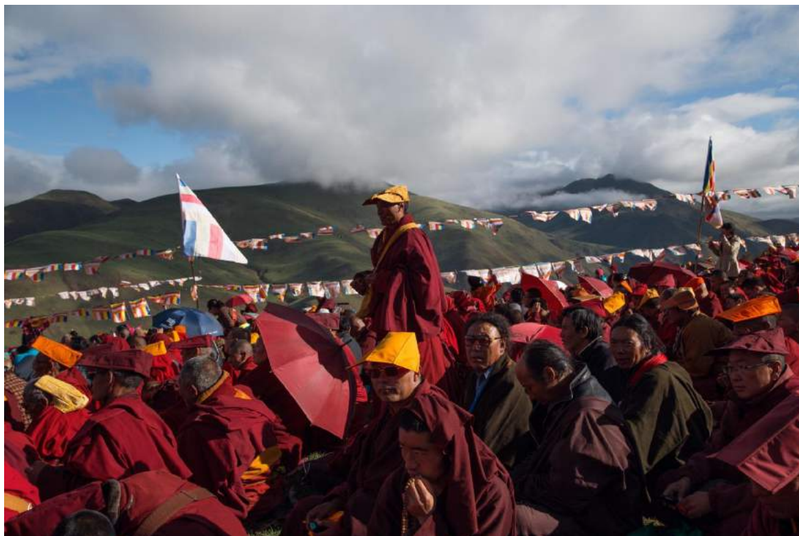
Mönche in Larung Gar.

Anfang Oktober 2016 wurde darüber berichtet, dass mehr als 300 chinesische Beamte nach Larung Gar gekommen sind, um die Bewohner nach ihrem Aufenthaltsstatus zu fragen. Die Beamten gingen von Tür zu Tür und fragten nach der Heimatstadt und Klöstern der Nonnen und Mönche, um sie ggf. für Vertreibungen vorzumerken. Die Leiter Larung Gars forderten die Nonnen und Mönche dazu auf, zu kooperieren und keine Angst oder Irritation zu zeigen.