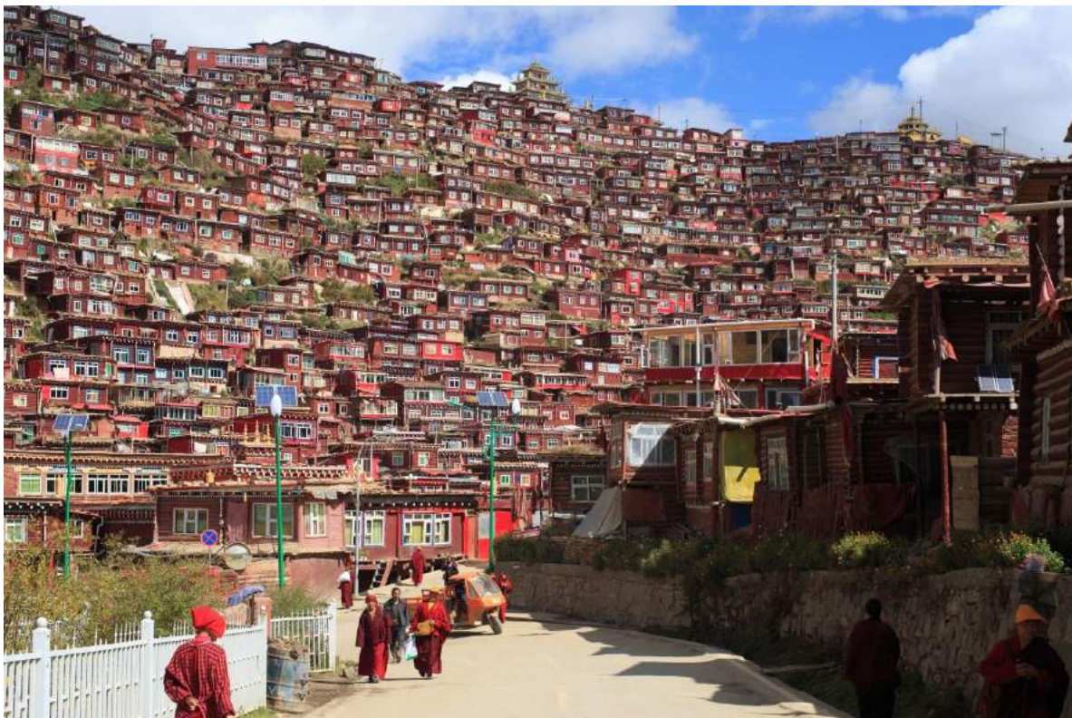
Larung Gar.

Bislang wurde von keinen Zwischenfällen berichtet, dennoch sichern bewaffnete Sicherheitsleute die Abrissstellen. Bevor die Zerstörung begann, wurden schätzungsweise 1.500 Polizisten und Paramilitärs in nahegelegenen Städten und Dörfern stationiert. Dies soll wohl vor allem der Abschreckung dienen.