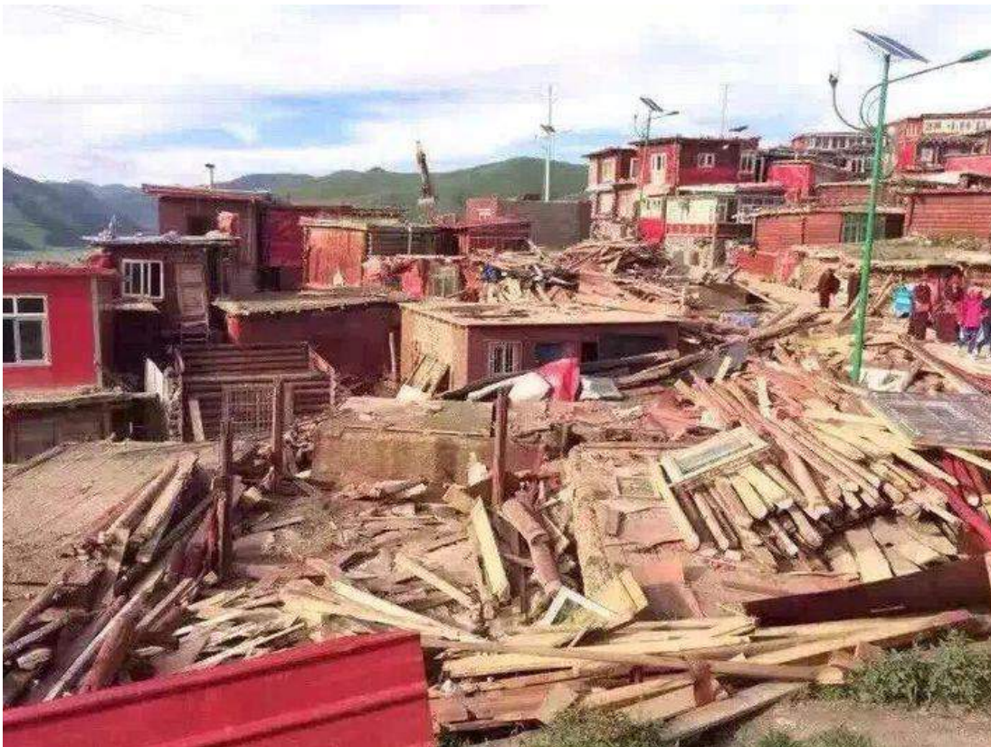
Zerstörung von Häusern in Larung Gar.