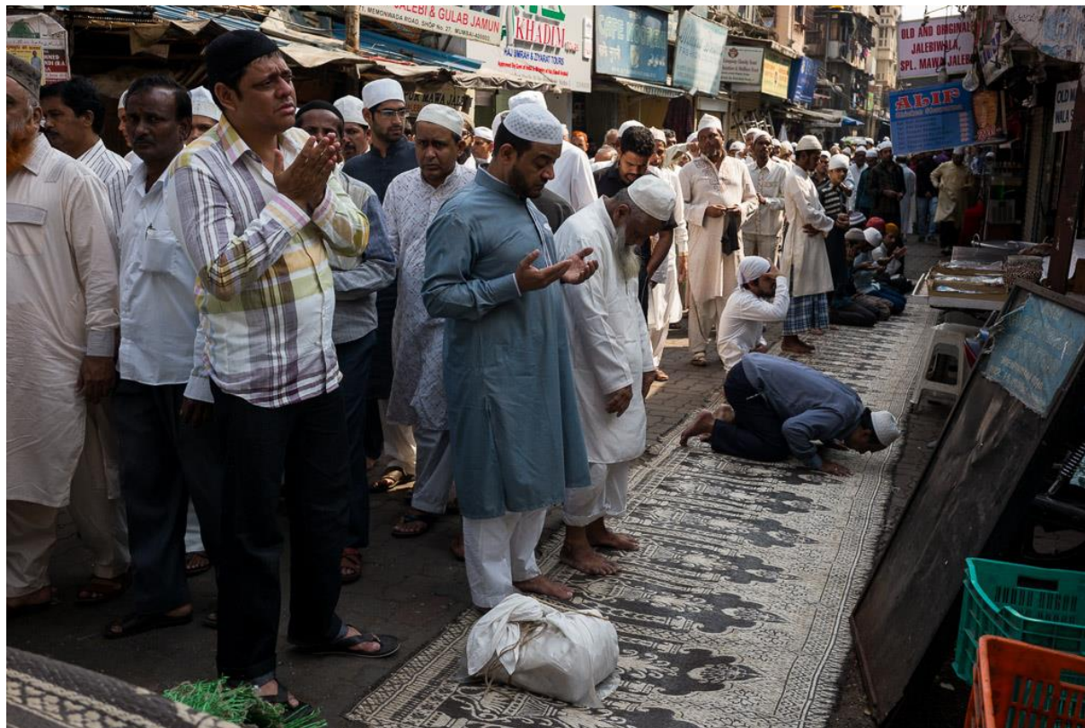
Nachmittags-Gebet von Muslimen in Mumbai.

Indiens 180 Millionen Muslime haben die Regierungsübernahme von Premierminister Narendra Modi im Mai 2014 mit besonderer Aufmerksamkeit und Sorge verfolgt. Denn viele Muslime machen Modi dafür verantwortlich, dass mindestens 790 Muslime und 254 Hindus bei schweren Pogromen im von der BJP regierten Bundesstaat Gujarat im Jahr 2002 getötet wurden. Das Schicksal von mehr als 220 bei den damaligen Ausschreitungen Verschwundenen ist noch immer nicht geklärt. Damals war Modi Chefminister des Bundesstaates. Bis heute werfen ihm Kritiker vor, nach Ausbruch der Gewalt zu lange untätig geblieben zu sein, so dass sich die Auseinandersetzungen zu einem Pogrom gegen die muslimische Bevölkerung entwickeln konnten.