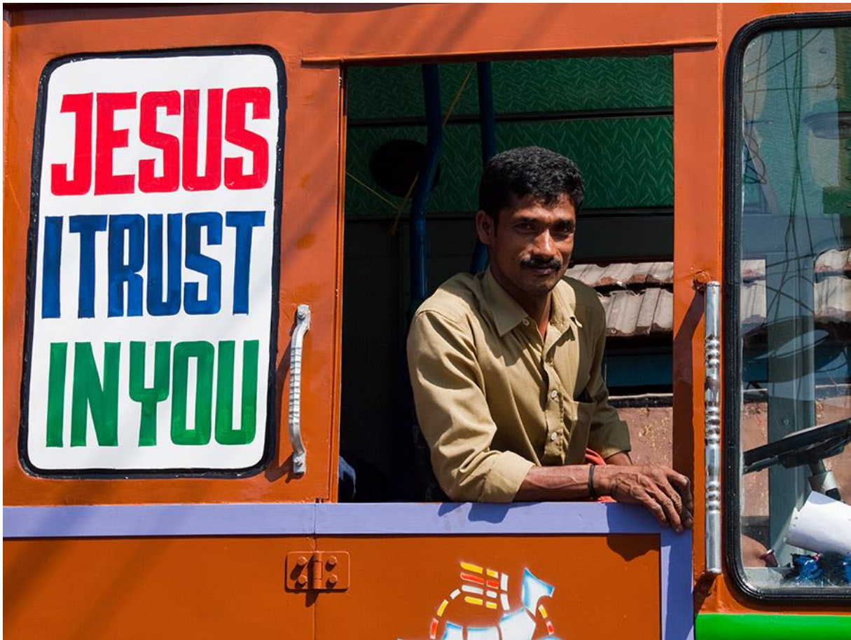
Dieser Christ in Kerala bekennt sich öffentlich zu seinem Glauben.