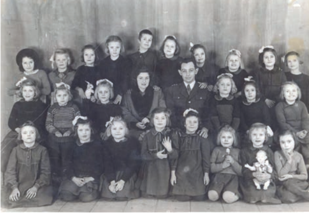
Kinder im staatlichen Waisenhaus in Bartenstein (Bartoszyce), Ostpreußen, Aufnahmezeitraum zwischen 1946 und 1948, © Digitales Archiv der Lokalen Tradition [Cyfrowe Archiwum Tradycji Lokalnej]