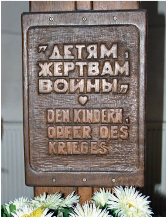
Gedenkkreuz in der evangelischen Kapelle des wiederaufgebauten Königsberger Domes. Es ist explizit den Kindern gewidmet, aufgenommen am 25. August 2016