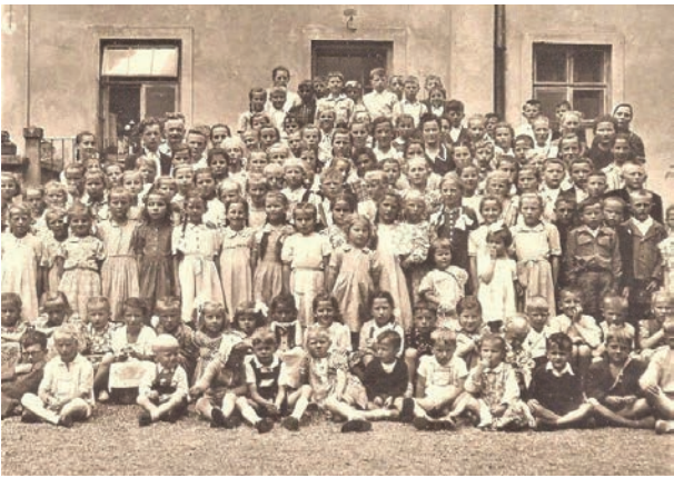
Kinder im evangelischen Kinderheim „Eben-Ezer“ in Dzingelau (Dzięgielów), Schlesien, Aufnahmezeitraum zwischen 1945 und 1949

cherheiten führte. Bei einigen dieser Kinder hinterließ die Polonisierungspolitik tiefe Narben. Sie fühlten sich entwurzelt, entrechtet und heimatlos. Sie unterdrückten ihre ethnische Identität und hatten kaum eine Möglichkeit, ihre Lebensumstände zu beeinflussen oder ihre Zukunft zu gestalten. Die Erfahrungen waren tiefprägend und die Betroffenen leben bis heute mit den Traumata ihrer Heimkindheit.