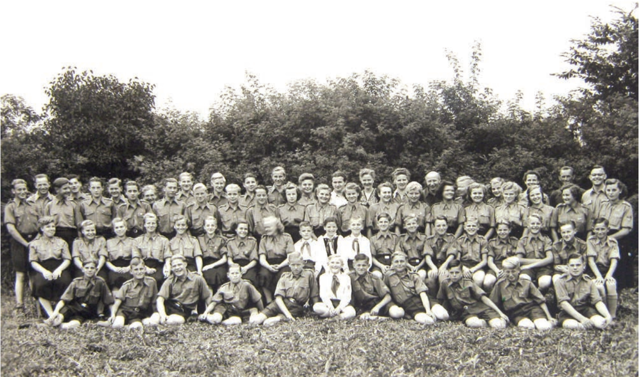
Inzwischen jugendlich gewordene anhanglose Wolfskinder aus dem Sondertransport mit 3.500 Ostpreußen von Litauen in die DDR, im August 1951 müssen sie sich dem Fotografen im Jugendheim Chemnitz-Bernsdorf in FDJ-Uniformen (Freie Deutsche Jugend) präsentieren.

Alle 55 Personen, mit denen ich zwischen 2011 und 2013 lebensbiografische Einzelinterviews für meine Doktorarbeit führen konnte, begegneten mir unabhängig von ihren materiellen Lebensumständen als mental starke Menschen. Sie sind Einzelkämpfer geblieben, waren selten in Vereinen oder politischen Organisationen aktiv, stattdessen auf Unsichtbarkeit und genaue Beobachtung konditioniert. Sie sind leise, aber prinzipienfeste Wege gegangen, mit einer Stärke aus sich heraus und der tiefen existenziellen Erfahrung, dass sie sich im Fall der Fälle nur auf sich selbst verlassen können.