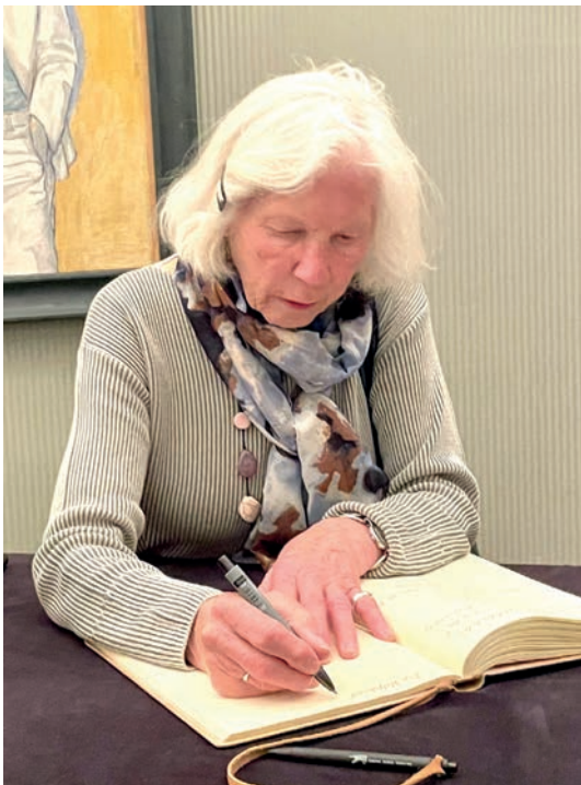
Eintragung ins Gästebuch, Nationales Dramatheater Kaunas, 11. September 2025