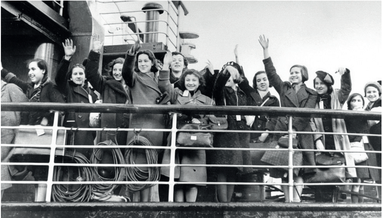
Jüdische Flüchtlingskinder aus Berlin treffen mit dem ersten Kindertransport am 2. Dezember 1938 in Harwich (Großbritannien) ein.

ten einen Raum, in dem junge Geflüchtete ihre Erfahrungen ordneten, Zugehörigkeiten aushandelten und sich selbst als Handelnde positionierten. In diesen alltäglichen Praktiken wird sichtbar, wie Kinder innerhalb enger Grenzen eigene Formen der Anpassung und Selbstbehauptung entwickelten. Agency lag weniger in großen Entscheidungen als in den kleinen, wiederkehrenden Handlungen des Alltags: im Umgang mit Heimweh, in der Gestaltung neuer Freundschaften, im Erlernen einer neuen Sprache oder im Versuch, Normalität herzustellen. Gerade diese unscheinbaren Formen des Handelns, die in Selbstzeugnissen sichtbar werden, zeigen, wie Kinder trotz Verfolgung und Entwurzelung aktiv an der Gestaltung ihres neuen Lebens mitwirkten.