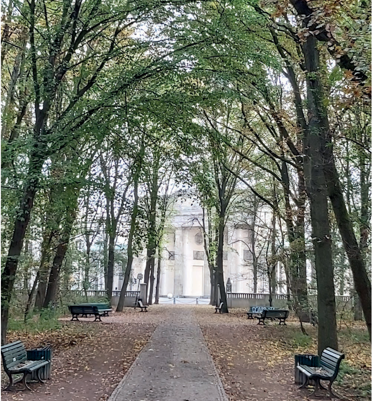
Blick aus dem herbstlichen Tiergarten auf das Brandenburger Tor, Wahrzeichen und Symbol der wechsellvollen deutschen Geschichte