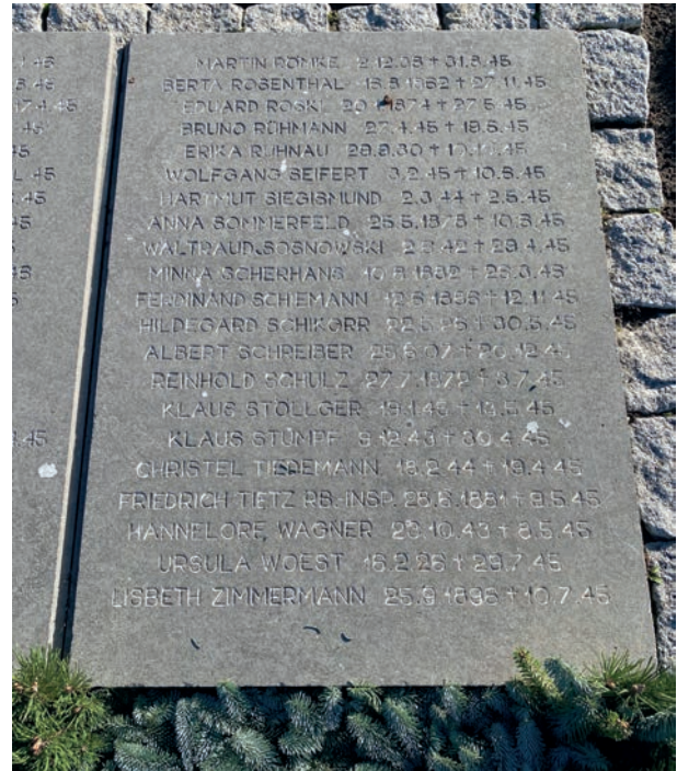
Ein Name unter vielen anderen. Grabplatte für den kleinen Klaus Stöllger und andere deutsche Flüchtlinge auf dem Friedhof in Middelfart, Westfünen, Dänemark.

wurde, bevor das Grab – zusammen mit drei weiteren auf dem Friedhof von Aarup – auf den Friedhof von Middelfart umgebettet wurde.